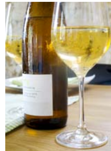
Der Hauswein der Weinkönigin

Mi–So ab 17.00 Uhr (April–Oktober sonntags auch 12.00–14.30 Uhr) Mo und Di Ruhetag