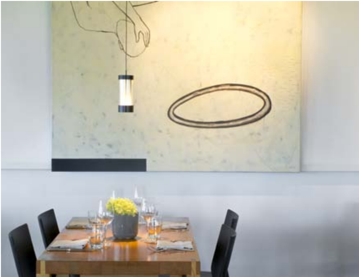
Wechselnde Kunstausstellungen bereichern das geschmackvolle Gourmetrestaurant

Lieblingsrezepten von Privatleuten, die sie einfach auf der Straße anspricht. Gekocht und gedreht wird in deren Privathaushalten, nur wenn keiner seine privaten Türen öffnen will, weicht das Team auf die öffentliche Gastronomie aus.