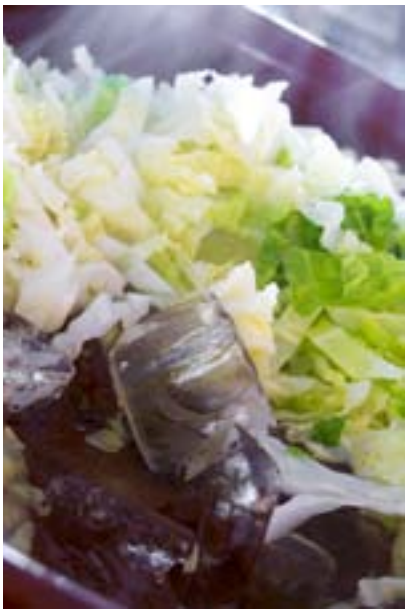
Durch das Abschrecken in Eiswasser behält der Wirsing seine Farbe und bleibt knackig.

■ Für den Kartoffel-Kastanienstampf die Kartoffeln schälen und in Salzwasser garen, danach im Sieb abtropfen lassen und zurück in den Topf geben.